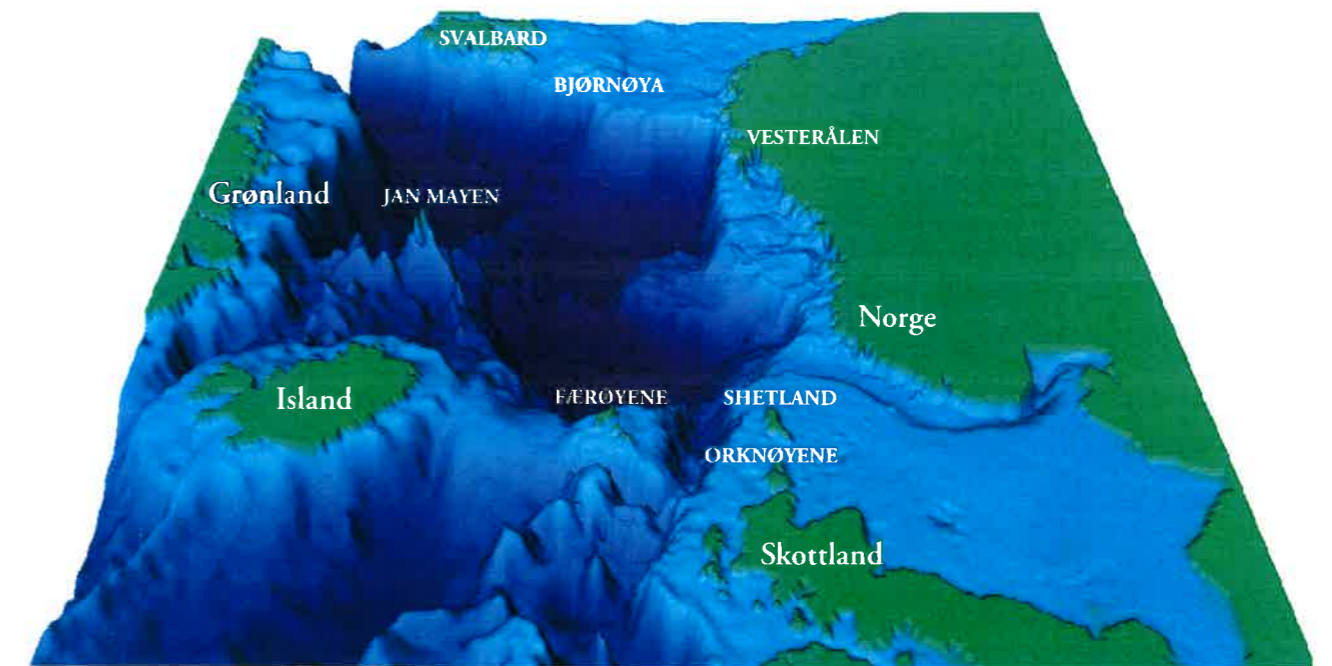
Bunntopografien i Norskehavet. Matematisk Institutt. Universitetet i Oslo, 1995.

Da skjøt den første båten inn vågen, flere fulgte straks i kjolvannet, og det letnet for dem som drog kjensel på sine. Dreggene raslet ut, båtene svaiet til og fikk ekstra fortøyninger. Men ti mann skipet seg på en otring og la seg innunder odden for å være rede, om det skulle trenges. De andre vasset opp hagen i søkkvåte klær. Det første bråttet gikk, men nådde ikke den båten som for en ørliten seillapp fløy gjennom. «Nå bryt ho att.» - En gammel fisker sa det, og kvinnene våndet seg. Paulina rev seg løs og stilte seg tvekroket ytterst utpå, for Lars-Johan-båten var den siste.(...)