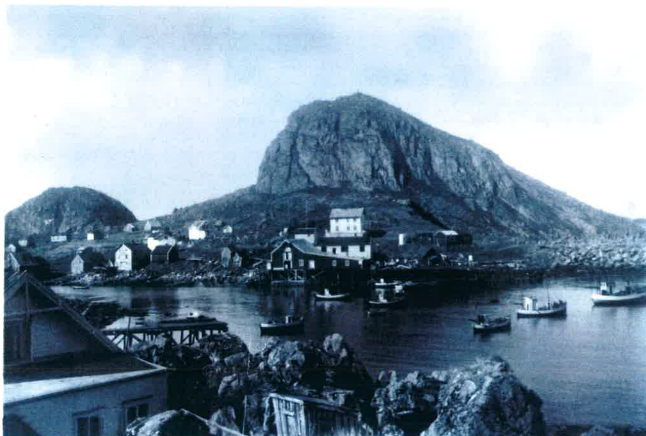
Fiskebruk og boliger. Nykvåg på 50-tallet.