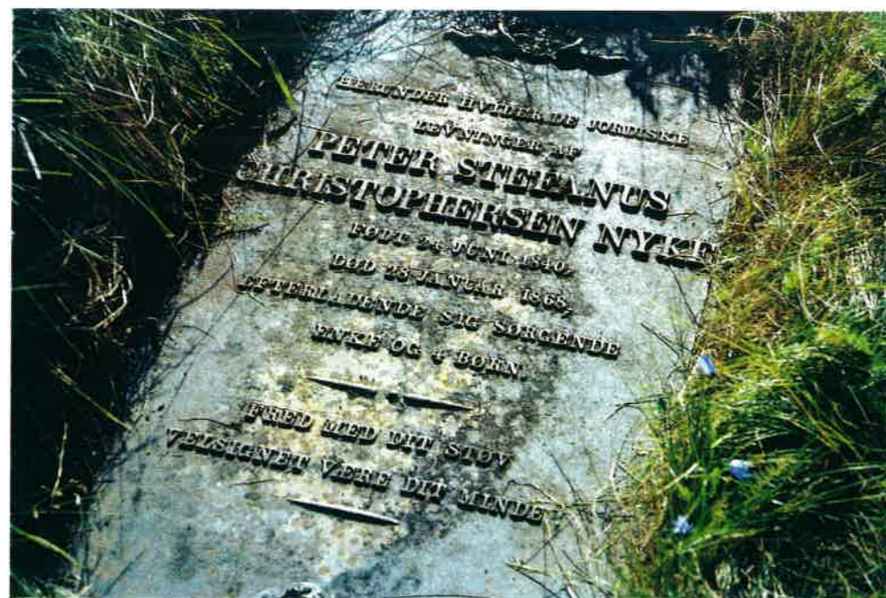
Sporene etter tragediene langs kysten er mange. Fra Malnes gamle kirkegård ved Hovden. Den overgrodde kirkegården ble valgt til Bø kommunes kulturminne i kulturminneåret 1997.

Hovden med den tilliggende Buholmen var i sin tid et stort fiskevær i Vesterålen. Engang driftet 65 nordlandsbåter; 25 fembøringer med garn, og 40 åttringer med line, fra været. I dag er det få faste fiskere her, men det drives fremdeles et godt vinterfiske fra Hovden med mange tilreisende fiskere i sesongen. Fiskebruket er overtatt av en ny lokal eier og er i full drift. Noe av fisken prekeveres på stedet, mens det meste fraktes til andre produktionssteder i Bø for videre bearbeidelse. En god del torskerogn blir i vintersesongen sukker-saltet i tønner og videre-sendt til kaviarproduksjon. Her er også bygget opp moderne velferdsrom for fiskerne, og kaiene er gode. Stedet aner en liten oppgang, på tross av at både skolen, butikken og posthuset forsvant i sentraliseringens dragsug for få år tilbake. De unge reiste bort fra bygda og ville ha annet arbeide enn det fiskeriene kunne tilby dem. På stedet, som i sin tid hadde over 200 innbyggere, er det i dag rundt 40 tilbake.