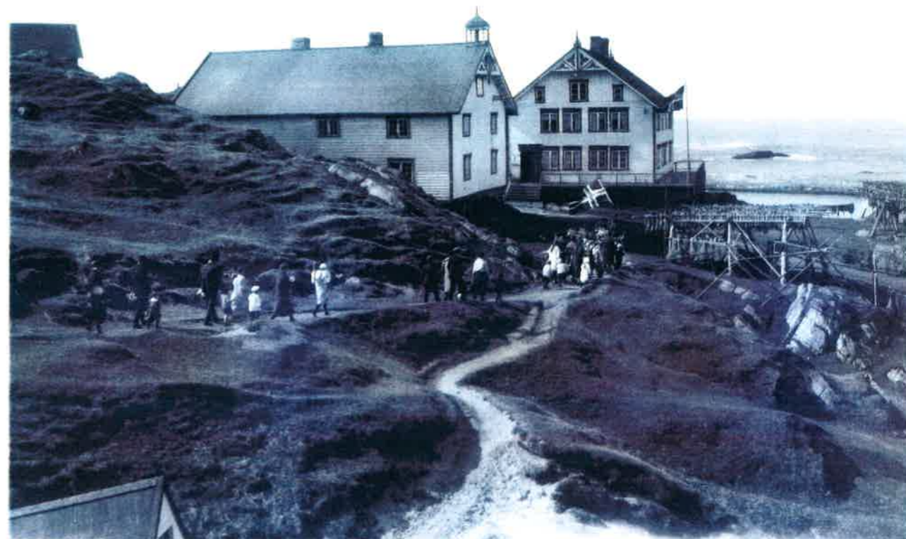
17. mai 1926. Hovedgården i Hovden med Bårgstuen.

«Frost og kuld, hunger og tørst, storm og regn, hagel og snee, skjorbug og landfarrot og spedalskhed er her iblandt den menige mand, og alt for meget der af, om det var ellers Guds villie. Pestilente kommer her ikke gierne, men det vilnende hav, hine grumme bølger og hiin skarpe søe, er de fattige folk som boer pestilente haard nok des værte, Gud bedre det saa sant. Her er intet got at være, det skall gud kiende, hvem ellers andre raad havde. Gud naade den som nød er til at frem drage sin tiid og alder udi denne ælendinge lands ende, for den jammer og ynk som mand hører og seer dagligdags paa dette fattige folk, maae komme et menneske til at græde, uden han ellers haver et steen hierte. Gud være os arme syndere naadig for sin søns Jesu Christi skyld.»